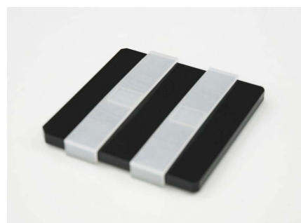
蓋、クリップを装着したところ

また、ケースサイズ、ワークサイズともにカスタマイズ可能なため、 さまざまなアプリケーションに適合します。