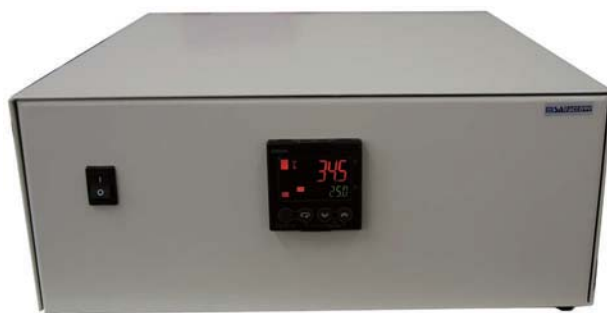
加熱冷却2出力コントローラー PCC107PED