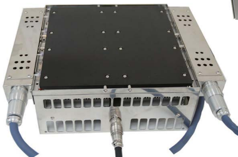
ヒータ・ペルチェ ホットプレート PJ-200